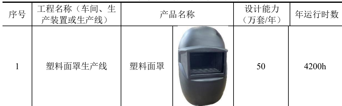
表 2-1 建设项目主体工程及产品方案